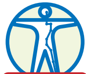
経筋・経穴刺激に