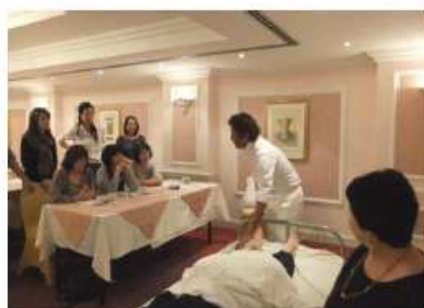
第2回ドバイセミナー