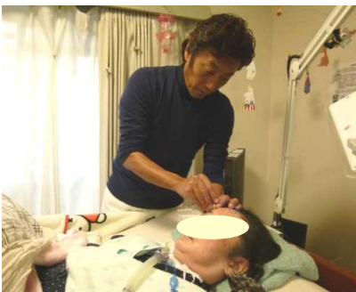
ALS患者に対する処置法(顔面部への刺鍼)