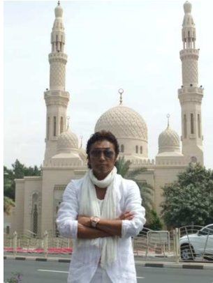
ジュメーラ・モスク前で