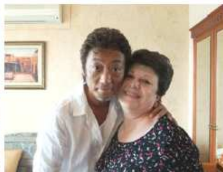
レバノンからの患者さんと