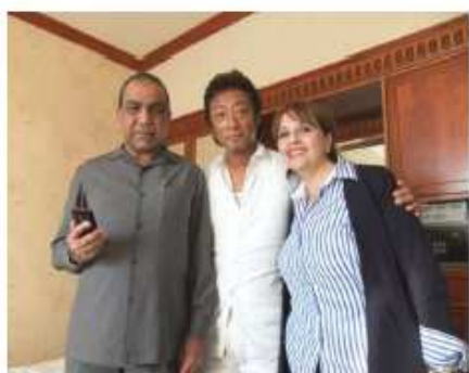
現地の患者さんと