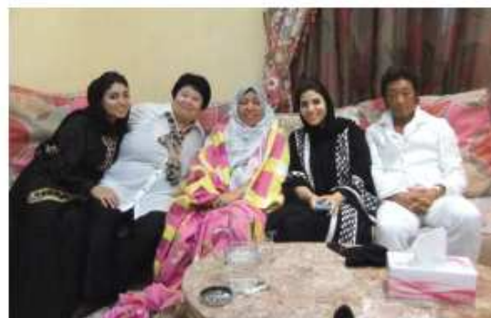
UAEの患者さんファミリー