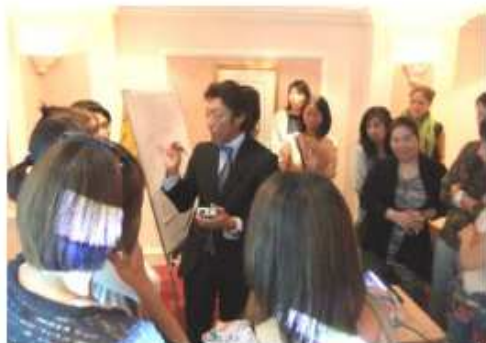
第1回ドバイセミナー